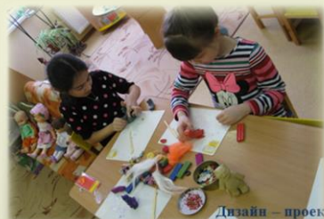
Дизайн – проект «Коты Санкт-Петербурга»