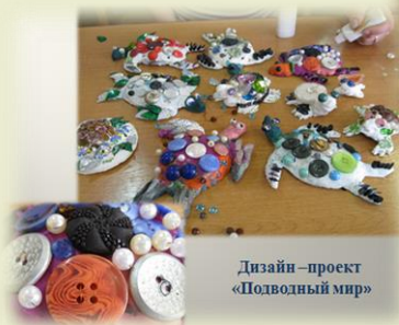
Дизайн – проект «Подводный мир»