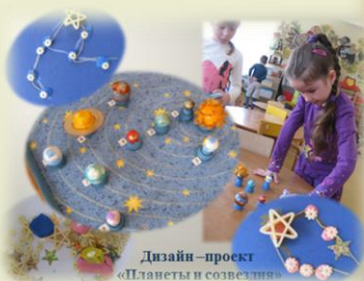
Дизайн – проект «Планеты и созвездия»